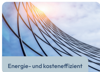
Energie- und kosteneffizient