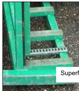
Superficie di appoggio

Le singole cataste di vetro non devono superare la profondità della superficie di appoggio.