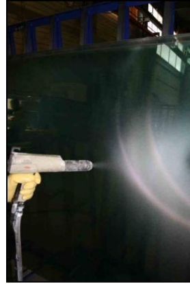
Polvere di lucite