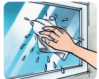
Zur Reinigung nur saubere, weiche Putztücher nehmen sowie viel klares, kalkarmes Wasser.