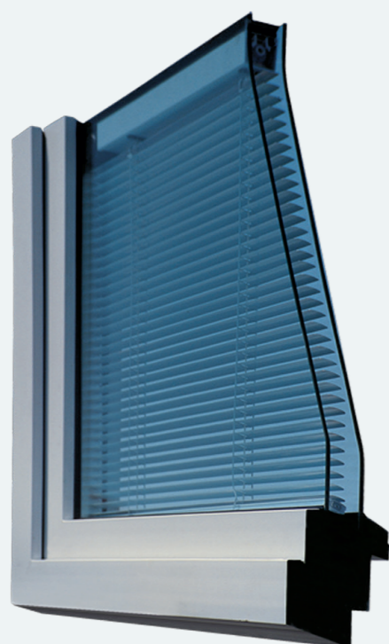
Le support d'ombrage est protégé dans l'espace intercalaire entre les vitres