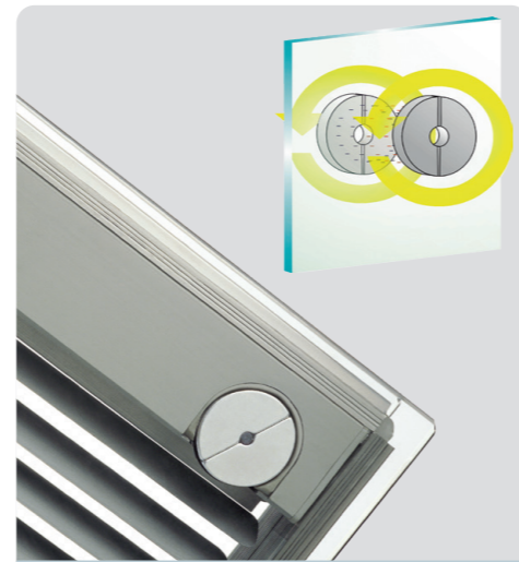
Système C: L'aimant extérieur est commandé par cordon ou moteur (en option).

Particularité du système C: En standard, l'aimant extérieur est commandé à l'aide d'un cordon. Un moteur extérieur optionnel peut également être installé ici ultérieurement.